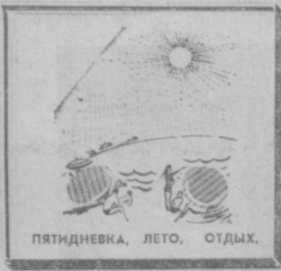
ПЯТИДНЕВКА, ЛЕТО, ОТДЫХ.