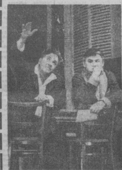
Снимок: сцена из спектакля «Единственный свидетель».