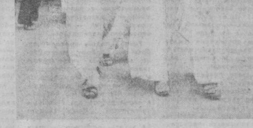
НА СНИМКЕ: женщины Демократической Республики Вьетнам — активные строители новой жизни. Они объединены в Союз женщин Вьетнама, созданный 23 года назад.

Под руководством Партии трудящихся Вьетнама и правительства ДРВ союз сплочивает женщин на выполнение стоящих перед республикой задач. Свыше двух миллионов женщин ДРВ участвуют в патриотическом движении «Три обязанности». Вместе с заботами о семье и детях вьетнамки ведут активную общественную и производственную деятельность, помогают воинам Народной армии и сами состоят в рядах защитников своей родины.