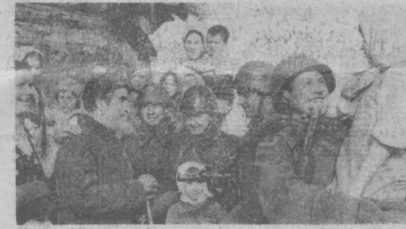
НА СНИМКЕ: в освобожденной белорусской деревне. 1944 г. Беспредельна радость советских людей: наши вернулись! Враг изгнан, коварный злодейский кошмар фашистской нечисти. (АПН).