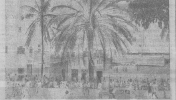
Столица Сомали — Могадишо по праву считается одним из красивейших городов на африканском побережье Индийского океана. Это шумный, по-южному пестрый и многоликий город, на улицах и площадях которого всегда илочком бьет жизнь. НА СНИМКЕ: в центральной части столицы.

тере. Оно состоит из насоса, баллонов, двух металлических распылителей и лопастной мешалки. Нефть, обработанная таким веществом и перемешанная с верхним слоем воды, превращается в капли, которые быстро падают на дно, смешиваясь с илом и разлагаются бактериями.