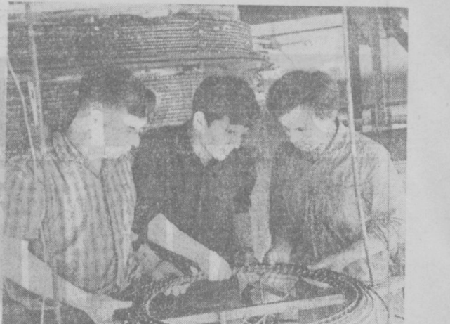
На Ташкентском заводском заводе работает реактор с электро-индукционным обогревом. Это новейшая техника, обеспечивающая минимальные затраты на производство высококачественной продукции.

Б. ЕРЛИН. В одном из крупнейших кинотеат- ров столицы ГДР — «Ин- тернациональ» состоя- лась премьера фильма «На- правление главного удара» третьей серии кинопо- лнометража «Огненная дуга».