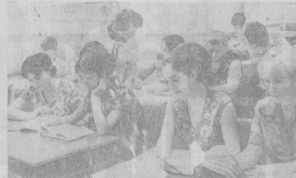
В РЕСПУБЛИКАНСКОЙ НАУЧНО-ТЕХНИЧЕСКОЙ

В СЕГДА многолюдно в читальных залах и в отделе абонентной службы республиканской научно-технической библиотеки Узбекского научно-исследовательского института технической информации. Сюда приходят, чтобы ознакомиться с новинками научно-технической литературы как отечественной, так и зарубежной. Библиотека имеет более 8 тысяч абонентов. С каждым годом растет ее фонд.