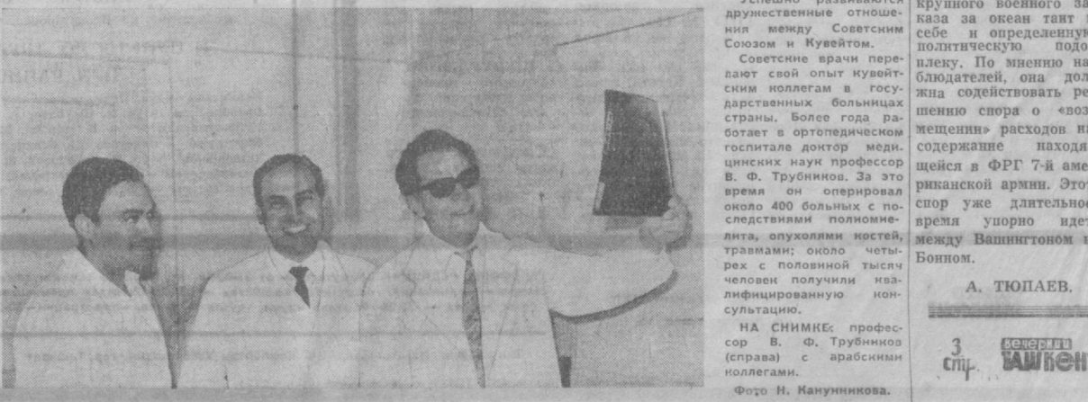
3 стр. ТАШКЕНТ