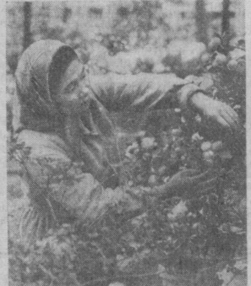
ДРВ. В Ханое имеется несносно оранжерей, где выращиваются различные сорта цветов. НА СНИМКЕ: в одной из оранжерей.