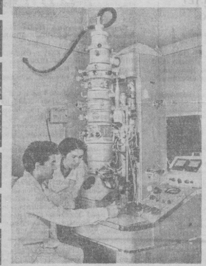
Таджикская ССР. Сотрудники Института физиологии и биофизики растений Академии наук Таджикской ССР изучают механизм регуляции жизнедеятельности растений на разных уровнях организации, молекулярном, субклеточном, клеточном, на уровне целого растения и растительного сообщества (посевы сельскохозяйственных культур, естественная растительность). Конечная цель этих исследований — управление ростом, развитием и фотосинтезом растений для повышения их продуктивности, получения устойчивых урожаев.

В настоящее время новый материал используется при строительстве животноводческих помещений в Белоруссии, Казахстане, Горьковской и других областях.