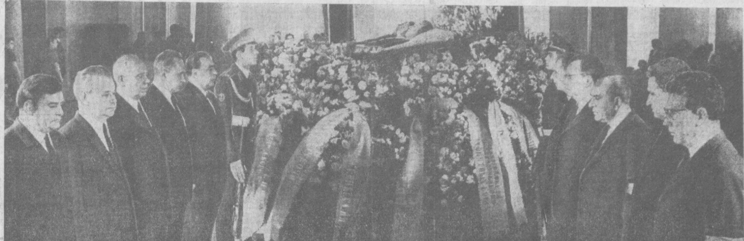
Краснознаменный зал Центрального Дома Советской Армии. В почетном карауле руководители Коммунистической партии и Советского правительства.

Между совхозом № 19 и опытно-конструкторским бюро достигнуто соглашение об осуществлении более широкой шефской помощи.