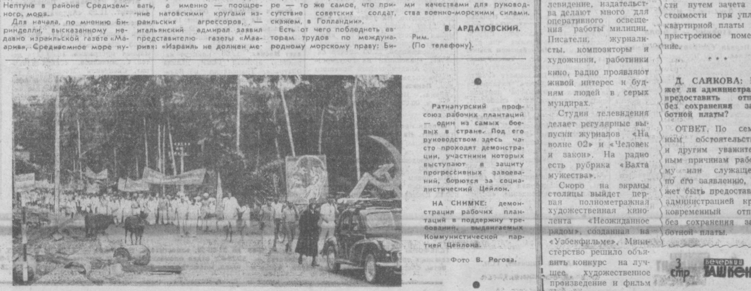
Ратнапурский профсоюз рабочих плантации — один из самых боевых в стране. Под его руководством здесь часто проходят демонстрации, участники которых выступают в защиту прогрессивных завоеваний, борются за социалистический Цейлон. НА СНИМКЕ: демонстрация рабочих плантации в поддержку требований, выдвигаемых Коммунистической партией Цейлона.