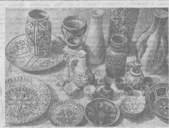
УЗБЕКСКАЯ ССР. Кувшины, вазы, пиалы, всевозможные сувениры из дерева, украшенные глянью и резьбой, оригинальные металлические изделия выпускает Ташкентский керамический завод.