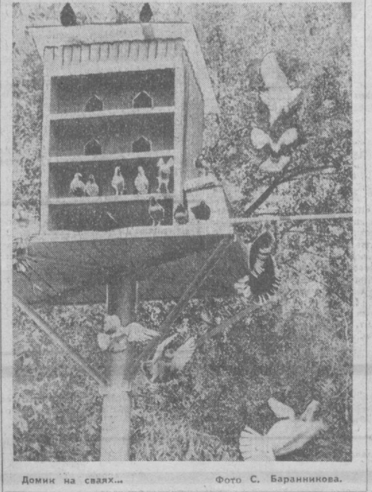
Домик на сваях...

«ЗОЛОТЫЕ РУКИ» ЮНЫХ УМЕЛЬЦЕВ ДАГЕСТАНСКИЕ аул Кубачи славны своими мастерами. Золотые и серебряные изделия, созданные их умелыми руками, радуют ценителей прекрасного. Традиции отцов и дедов продолжают юные кубачинцы. На уроках труда старшего класса кубачинских школ учатся обрабатывать серебро, осваивают процессы позолоты и другие тонкие операции. Многие изделия ребят экспонировались на международных выставках. На «Экспо-70» в Японии посетители восхищались изделиями юных умельцев из Дагестана. Сейчас работы школьников из Кубачей демонстрируются на ВДНХ СССР. НА СНИМКЕ: серебряный мушкет и чашки — работы юных кубачинцев.