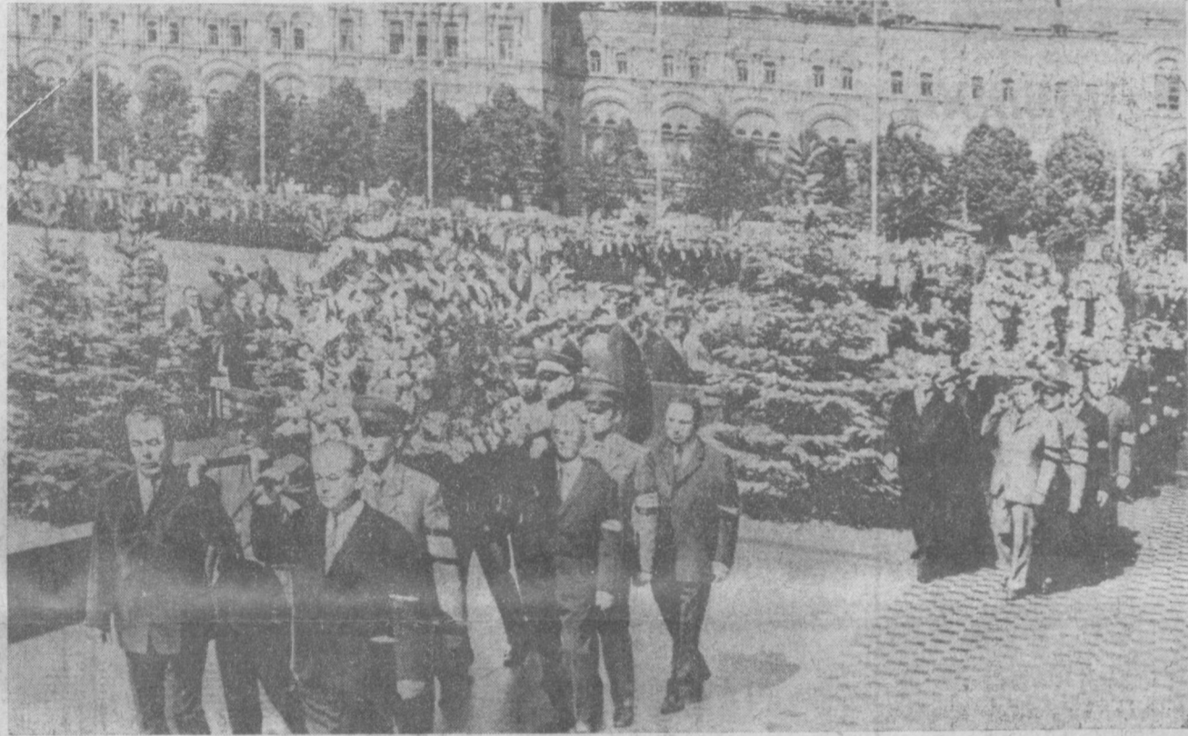
МОСКВА. 2 июля. Красная площадь. Траурная процессия направляется к Кремлевской стене.

Начинается траурный митинг. Его открывает член Политбюро ЦК КПСС, секретарь ЦК КПСС А. П. Кириленко.