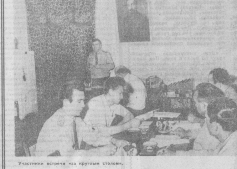
Участники встречи «за круглым столом».

Узбекский экспериментальный институт травматологии и ортопедии проанализировал количество больных, поступивших в результате уличных травм за последние семь лет.