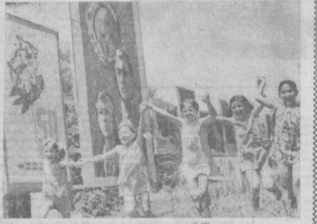
Идет пионерское лето. Во всех живописных и прохладных уголках Узбекистана можно увидеть в эти дни отдыхающих детей. Одной из таких детских здравниц новых типов является пионерлагерь «Мир», расположенный в Анташе Бостанликинского района. НА СНИМКЕ: группа отдыхающих девочек около аллеи Комсомольцев.

О ДНАЖДЫ на встрече с любителями футбола меня спросили: «Какое место в мире занимает сборная СССР?». Во время устных диспутов времени для обсуждения «клубов» так мало, как в шахматной партии блитцтурнира. И я отвечаю: «Следом за сборными Бразилии и Англии». Помню, что в зале возник шум. Как видно, болельщики не очень согласны с моей оценкой. Да и мне самому она долго не давала покоя: viszont не освободит от ответственности.