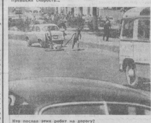
Кто послал этих ребят на дорогу?