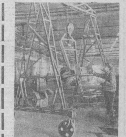
САМАРКАНДСКАЯ ОБЛАСТЬ. Коллектив самаркандского ремонтного завода «Узсельхозтехника» выпускает колесные краны на колесах. Их грузоподъемность — 3 тонны. Механизм предназначен для ремонтных мастерских колхозов и совхозов. Фото А. Кузьменко. (УзТАГ).

ЧУКУС. Еще на 20 мощных плавучих насосных станциях увеличилась водоподъемная флотилия Каракалпакстана. Сейчас часть их уже плавает в крупных каналах «Бейгаб» и «Бенилюзия», а остальные осущают магистральные коллекторы. Астраханские и запорожские судостроители, построившие эти станции, вскоре поставят Каракалпакстану еще 29 агрегатов. До конца года водоподъемная флотилия автономной республики будет насчитывать свыше 80 судов. (УзТАГ).