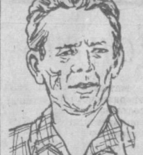
Рис. Н. Меламеда.

* ОТ ЗАРИ, НО НЕ ДО ЗАРИ * МРАМОР НА СТРОЙКУ НЕ ПОСТУПАЕТ * НЕ ВСЕГДА МОЛЧАНИЕ — ЗОЛОТО