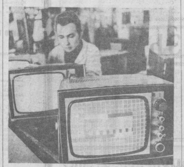
80 процентов всех венгерских телевизоров выпускает завод «Видетон» в крупном промышленном центре Секешфехервар. Его продукция хорошо известна в странах, импортирующих эти изделия. НА СНИМКЕ: контролируется качество нового портативного малогабаритного телевизора «Минивизор».

человеческого гения — дрезденский дворец «Цвингер» с картинной галереей. Почетное место на туристских маршрутах занимают район «Бастай», именуемый «санктонской Швейцарией», потемкинский музей «Сан-Суси» и дворец «Цейлиенхоф», где более 25 лет назад было подписано Потсдамское соглашение. Из года в год вместе с ростом международного авторитета ГДР во всем мире растет интерес к немецкому рабочекрестьянскому государству. Сейчас зарубежных гостей здесь бывает в 15 раз больше, чем 10 лет назад. Ежегодно около миллиона иностранцев из 80 стран мира знакомятся с жизнью и достопримечательностями ГДР. Неуловимо развиваются туристические связи между ГДР и Советским Союзом. За последние 10 лет в ГДР побывало 750 тысяч советских туристов, а Советскую страну за это время посетили более одного миллиона граждан ГДР — в пять раз больше, чем в 1960 году.