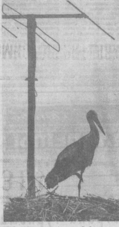
С комфортом...