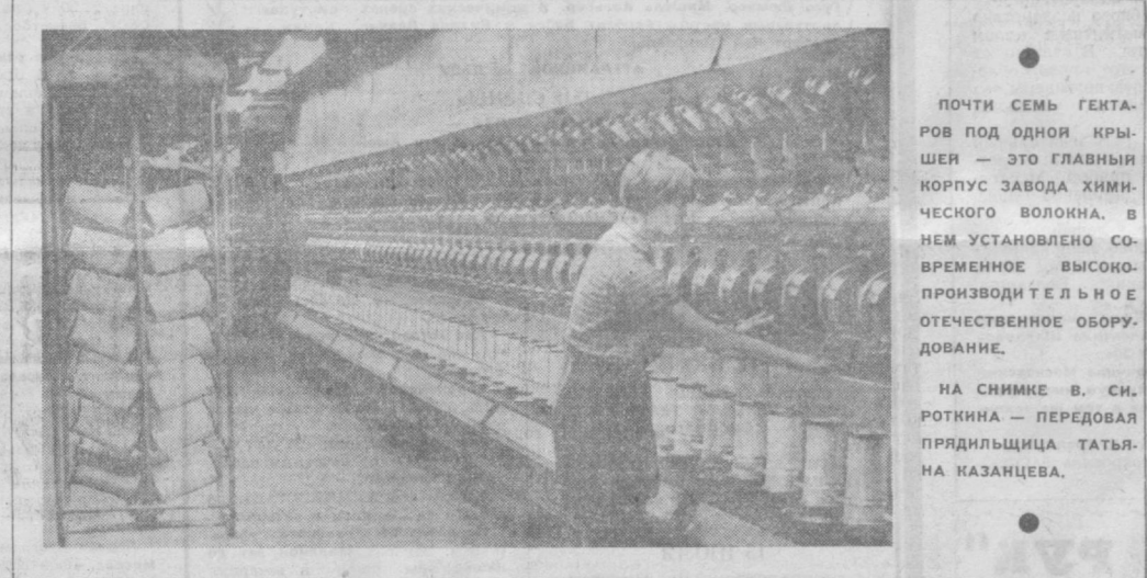
ПОЧТИ СЕМЬ ГЕКТАРОВ ПОД ОДНОЙ КРЫШЕЙ — ЭТО ГЛАВНЫЙ КОРПУС ЗАВОДА ХИМИЧЕСКОГО ВОЛОКНА. В НЕМ УСТАНОВЛЕНО СОВРЕМЕННОЕ ВЫСОКОПРОИЗВОДИТЕЛЬНОЕ ОТЕЧЕСТВЕННОЕ ОБОРУДОВАНИЕ. НА СНИМКЕ В. СИРОТКИНА — ПЕРЕДОВАЯ ПРЯДИЛЬНИЦА ТАТЬЯНА КАЗАНЦЕВА.