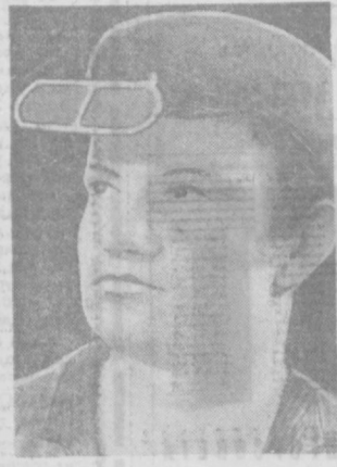
по которому стекает стальной огонь. До того смотрели, что заломило в глазах. А через день подали заявление о переводе их в сталелитейный цех завальщиками.