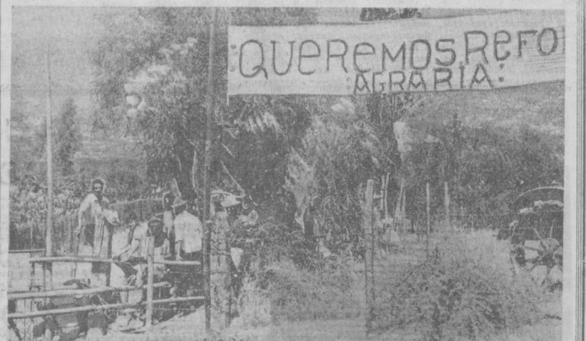
ЧИЛИ. Земельный вопрос в Чили — один из самых острых, доставшихся в наследство правительству бона Народное единство. Решение правительства Альенде о проведении аграрной реформы встретило сопротивление крупных землевладельцев. В южной провинции Каутин они пытались помешать осуществлению реформы. Однако крестьяне при поддержке правительства заняли пустующие помещичьи земли, организуют на них кооперативы по совместной обработке земли.

НА СНИМКЕ: рабочие поместья Тапуе провинции Сантьяго вывесили лозунг, призывающий к проведению аграрной реформы.