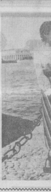
Славянск (Донецкая область).

К ОПОРИТ летнего Ленинграда, его неповторимой поры белых ночей, элегантность и строгость силуэтов города на Неве отразила новая коллекция одежды, разработанная художниками Ленинградского Дома модели. Художники предлагают для женщин легкие выходящие костюмы из шерстяных тканей, платья из набивного шелка в сочетании с легким пальто, блузы с удлиненными юбками, брошечные костюмы. В коллекции большое место отводится комплектам, которые позволяют варьировать вещи, создавая различные новые комбинации. Это — брошечные костюмы с юбкой, жакетом, жилетом и шарфом. В моделях широко используются мотивы русского национального костюма, элементы крестьянских платьев — рюши, оборки, мелкий цветочный рисунок на темном фоне. НА СНИМКАХ: сверху — летние нарядные костюмы для улицы. Авторы моделей — Моника Вайтца и Александр Осенкин; внизу — нарядные ансамбли для молодежи. Юбка удлиненная, выполненная из шерстяной ткани, блуза — из шелка. Костюм молодого человека дополнен рубашкой из кружевного полотна. Авторы моделей — художники Лилия Васильева и Александр Мезин.