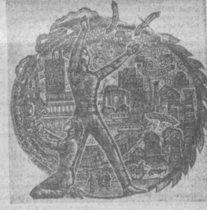
Новая гравюра И. Цыганова «Узбекистан»