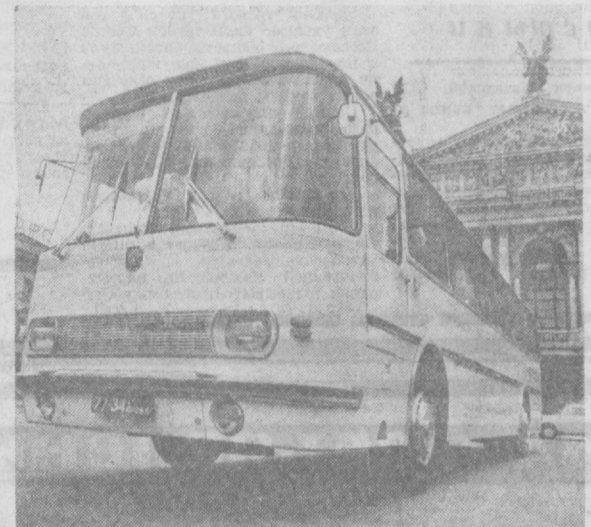
Скорость, удобство, комфорт

ТБИЛИСИ. Атомы и нейтроны разнородных материалов способны образовывать прочные связи при высоких температурах и низком давлении. Это свойство использовано в производственных условиях для сварки металлов. По такому принципу действуют установки, созданные в Тбилисском отделении Всесоюзного научно-исследовательского института электросварочного оборудования для минских тракторостроителей. В вакууме прочно соединяются детали из бронзы и стали дифференциала трактора. Такой способ изготовления деталей сложных узлов значительно улучшает их качество, более чем на 500 часов удлинит срок работы дифференциалов.