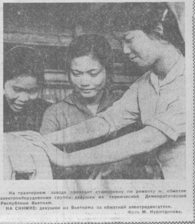
На транзитном заводе проходит стажировку по ремонту и обмотке электродвигателей группа девушек из героической Демократической Республики Вьетнам.

Сегодня по просьбе вьетнамских друзей Н. ВИКТОРОВ.