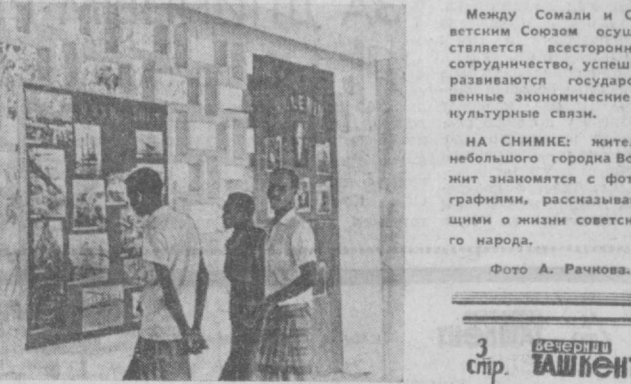
Между Сомали и Советским Союзом осуществляется всестороннее сотрудничество, успешно развиваются государственные экономические и культурные связи. НА СНИМКЕ: жители небольшого городка Воджид знакомятся с фотографиями, рассказывающими о жизни советского народа.

ЛУСАКА. Сообщения, поступающие из Йоганнесбурга, свидетельствуют о том, что расистские власти ЮАР идут на все новые уловки с целью завлечь отдельные африканские страны в тенетах своей политики «диалога», с помощью которой они стремятся внести раскол в ряды независимой Африки. С этой целью в международном аэропорту близ Йоганнесбурга выстроен гигантский «многорасовый» отель. По замыслу правитель претории, в нем смогут оставаться африканские представители ЮАР и США. В «международном междрасовом симпозиуме», как назвала это мероприятие южноафриканская пресса, помимо представителей ЮАР и США, приняла участие также несколько английских и отдельные представители Лесото и Свазиленда — двух германских государств на юге континента, окруженных со всех сторон территорией южноафриканского рейка. Сообщая об открытии этого совещания, южноафриканская газета «Ранд дейли мейл» отмечает, что, несмотря на довольно тенденциозный подбор его участников, работа «симпозиума» окружена «стражающей секретностью».