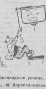
Бесплодные усилия. Рис. М. Воробейчикова.

По поручению жителей 20-го квартала Чиланзара — Г. ПОЛУЭКТОВ.