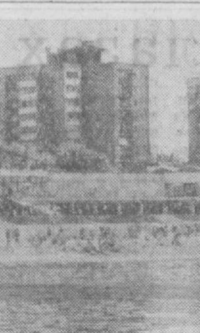
НА СНИМКЕ: на новом пляже.