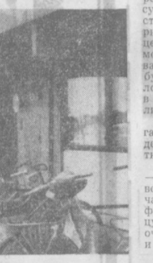
В пригороде Копенгагена нам удалось увидеть санаторий адвентистов.