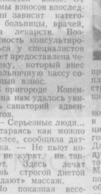
— Серьезные люди... — стараясь как можно веселее, сообщила датчанка.