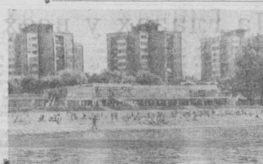
ВАРШАВА. Недавно близ моста Понятовского на берегу Вислы открылся еще один в польской столице центр отдыха. Здесь оборудованы просторные пляжи, построены три бассейна.

В АШИНГТОН. Действия Соединенных Штатов во Вьетнаме и Лаосе могут сравниться лишь с действиями нацистской Германии времён второй мировой войны, уничтожавших мирное население, заявил активный критик политики правительства США в Индикативе член палаты представителей Поль Макклоски. «Мы делаем то же самое в Лаосе и Южном Вьетнаме», — подчеркнул Макклоски, выступая в телевизионной программе компании «Эн-Би-Си». Макклоски заявил также, что его решение участвовать в первичных президентских выборах в избирательной кампании 1972 года основывается на необходимости заострить внимание на войне, «в которую американский народ не верит и которую презирает».