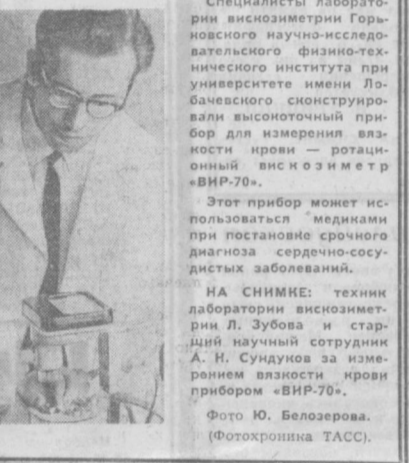
Специалисты лаборатории висзиметрии Горьковского научно-исследовательского физиологического института при Университете имени Лаврентьева сконструировали висзиметрический прибор для измерения вязкости крови — ротационный висзиметр «ВР-70».

мелкой кукурузной крупы или другой пищевой основы (жареные или пшеничные отруби, пшеничные злебы 2-го сорта без корки). Приманки раскладывают на полу по ходу передвижения и в местах скопления тараканов. Через 7—10 дней приманки заменяются свежими. Во всех случаях борьбы с бытовыми насекомыми и особенно с тараканами наибольший эффект может принести лишь тогда, когда к ней подключаются все жители многоквартирных домов.