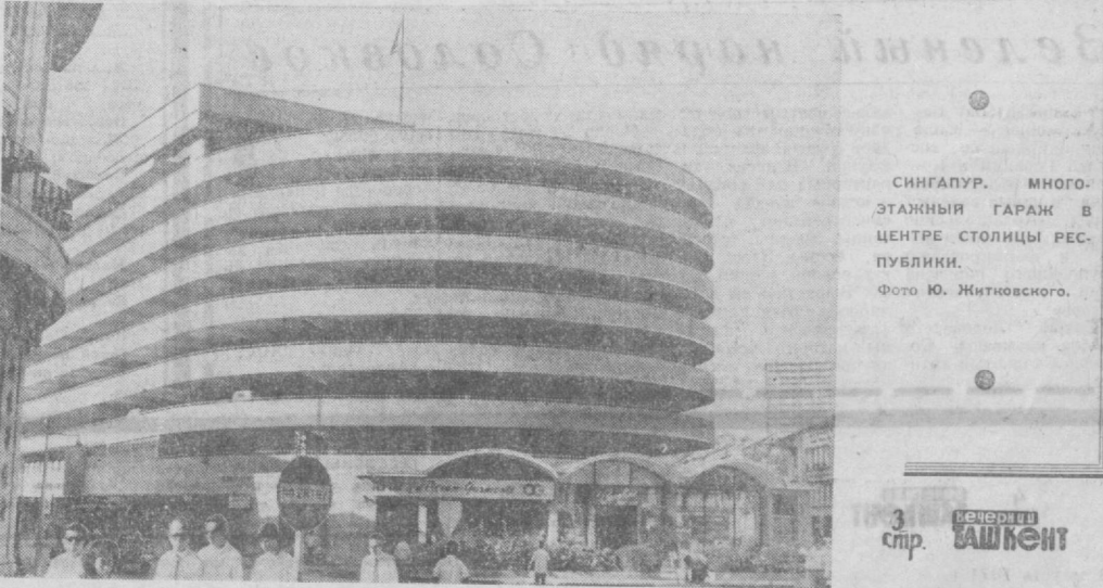
СИНГАПУР. МНОГОЭТАЖНЫЙ ГАРАЖ В ЦЕНТРЕ СТОЛИЦЫ РЕСПУБЛИКИ.

колонизаторы никогда не пытались предпринять меры для экономического развития. Более того, они сознательно используют голод как средство политического воздействия и подавления освободительного движения. Кабрал пишет, что на протяжении XX века население островов пережило 21 голодный год, каждый из которых приводил к вымиранию от 15 до 35 процентов всего населения. Сейчас голод вновь угрожает смертью десяткам тысяч людей, и если не будет предпринято эффективных мер, население островов уменьшится на 30—50 процентов. На большей части островов население уже умирает в результате высокой смертности от голода и вывоза африканцев на принудительные работы в другие колонии. Африканская партия независимости Гвинеи и островов Зеленого мыса, говорит в письме, обращается к организации Объединенных Наций, правительствам стран, национальным и международным организациям с настоятельной просьбой использовать все средства для оказания помощи и предотвращения катастрофы. Она требует, чтобы правительство Португалии прекратило использовать голод в качестве средства политического давления, и заявляет о непоколебимой решимости продолжать борьбу за освобождение островов Зеленого мыса до победного конца.