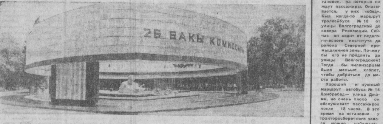
Одну из площадей столицы Азербайджана украшает мемориальный ансамбль «26 банкинских комиссаров». Создатели его — архитекторы Г. А. Алескеров, А. Н. А. Гусейнов, скульпторы М. И. Зейналов и М. М.-Ю. Мамедов (посмертно). НА СНИМКЕ: мемориальный ансамбль «26 банкинских комиссаров».

Хороший и нужный маршрут автобуса № 14 Дюбрабад — улица Динами, но очень плохо он обслуживает пассажиров после 18 часов. В это время на остановке у тракторосборочного завода можно наблюдать, как машины вереницей одна за другой пустыми мчатся снова на «обед». Г. РУБИНОВ.