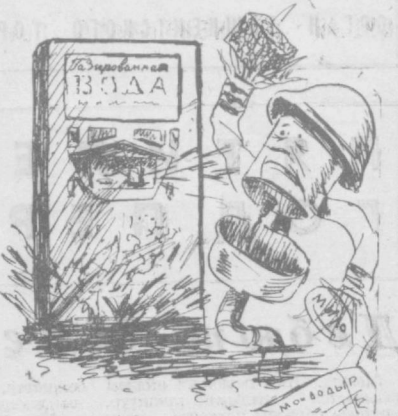
Ах, ты, гадкий, неумный!