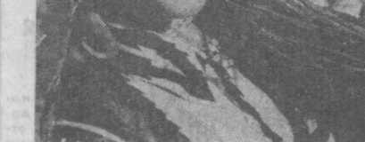
Сырдарьинская область. Динамичный плодотворный совхоз имени академика Р. Р. Шредера в нынешнем году вырастил и передал хозяйствам области полмиллиона виноградных и 180 тысяч плодовых саженцев.

Коллектив этой организации, как правило, перекрывает производственную программу, строит быстро, дешево, надежно. Сейчас он опережает график строительства жилищных работ почти на месяц.