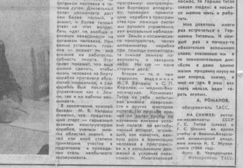
На снимке: Герман Титов (слева) и Г. С. Шонин во время учебы в Военно-воздушной инженерной академии имени Н. Е. Жуковского (1964 год).

КИЛОМЕТРЫ ТАБАЧНОГО ЛИСТА В республике взят курс на индустриализацию табаководства. Строятся первые 30 крупных комплексов для выращивания табачной рассады с использованием элентрообогрева. Хозяйства приобретают полуавтоматические прессы для упаковки табака в стандартные кипы. Такие прессы, выпуск которых начал завод «Молдсейхозтехника» в Бендерах, позволяют одному человеку за час сделать более двадцати кип, в то время как вручную можно подготовить к отправке на завод всего шесть-семь тюнов.