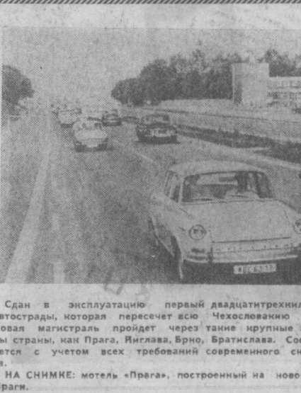
Сдан в эксплуатацию первый двадцатитрёхкилометровый участок автострады, которая пересечёт все Чехословацкие заводы на востоке. Новая магистраль пройдет через такие крупные экономические центры страны, как Прага, Виллаш, Врне, Братислава. Сооружение дороги ведется с учетом всех требований современного скоростного транспорта.

Сегодня в Ташкенте малооблачная погода без осадков. Ветер 2-7 метров в секунду. Температура воздуха 14-18, днем 32-34°.