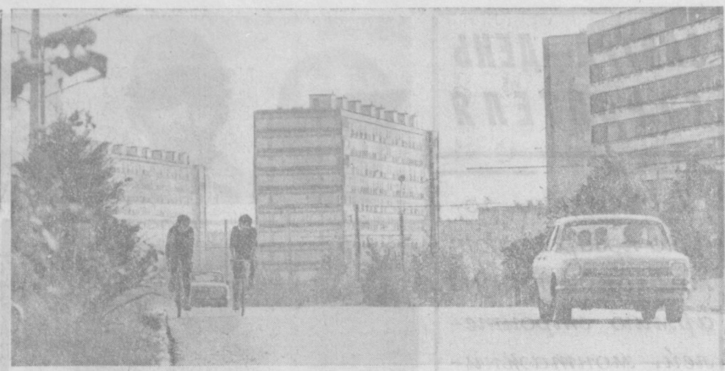
ТАШКЕНТ СЕГОДНЯ. Вид на проспект Дружбы народов.

расчета работает свыше 2 тысяч человек. Работа по методу бригадного подряда оказывает существенное влияние на качество работ, резкое сокращение производственных затрат от брака и недоделок. Сроки строительства объектов сократились в среднем на 7—8 процентов. Широко внедряется в строительстве система саратовской системы контроля за качеством, метод донецких автомобильных строителей и предприятий Главки все больше распространяется по бригадам А. Васова — работать высокопроизводительно, без травм и аварий, основываясь на трехступенчатом методе контроля за состоянием, техники безопасности. Если в 1972 году в Главташкентстрое насчитывалось несколько десятков бригад, подхвативших этот почин, то в 1973 году их было уже более 300, а в настоящее время в наших подразделениях насчитывается около тысячи таких бригад. В организациях и предприятиях Главки с каждым днем ширится и крепнет движение