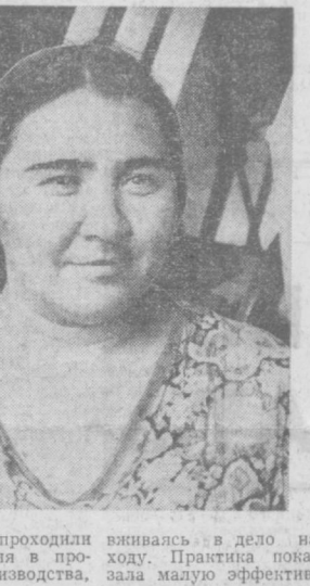
Новички проходили курс обучения в процессе производства.

Для нашей фабрики годы девятой пятилетки стали поистине временем больших перемен. За период, прошедший с XXIV съезда партии, деятельность предприятия коренным образом изменилась. Если в прошлые годы коллектив был занят промышленным выпуском шелка, то с начала девятой пятилетки усилился рабочий труд работников предприятия на перевооружение производства, на превращение фабрики в единственное в своем роде предприятие по испытанию новых образцов коконов, вырабатываемых во всех концах страны. Перестройка потребовала от коллектива огромных усилий, творческого труда, новых знаний.