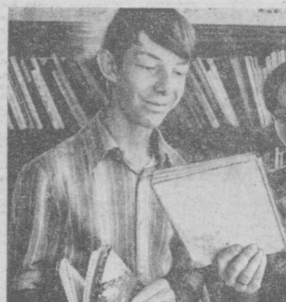
Детская библиотека имени М. Горького — одна из лучших в Куйбышевском районе. Полторы тысячи школьников пользуются ее фондами.