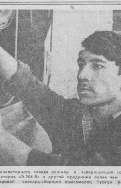
Машинист-оператор экскаваторного завода решил в завершающем году пятилетки выпустить сверх плана 10 экскаваторов «З-304-В» и другой продукции более чем на 700 тысяч рублей.

В результате уже сейчас повышена производительность труда почти на десятую часть, снижены на 1 копейку затраты на рубль товарной продукции, сверхплановая прибыль составила 28 тысяч рублей. Дополнительно к заданию семи месяцев выпущено 1,750 газовых плит.