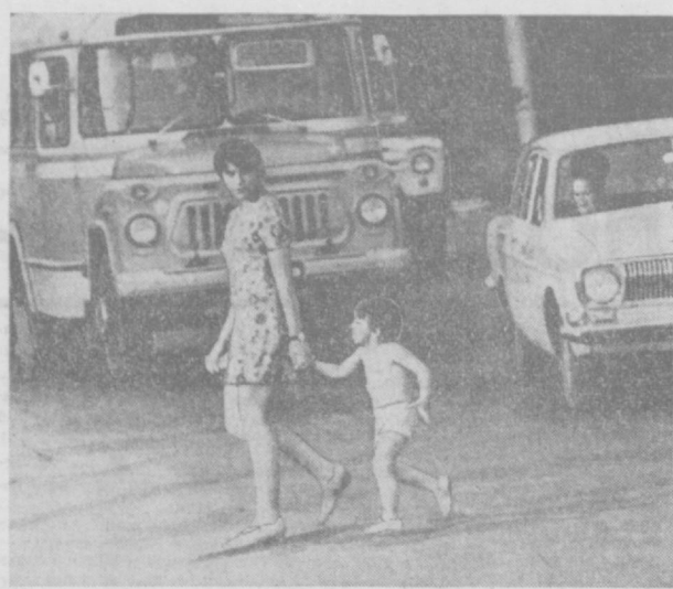
Улицы и пешеход