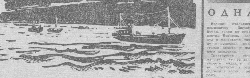
У рыбаков Арала. Из альбома художника.

И наша душа вновь переживаете то смущение мысли, то причастность к большому делу. И наша душа вновь переживаете то смущение мысли, то причастность к большому делу.