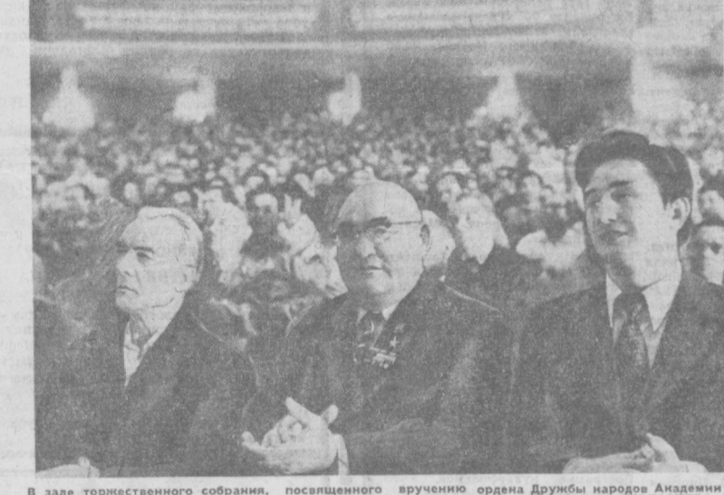
В зале торжественного собрания, посвященного вручению ордена Дружбы народов Академии наук Узбекской ССР.

культуры народа. Ученые Узбекистана вместе со всеми трудящимися республики полны решимости встретить XXV съезд нашей родной Коммунистической партии новыми творческими успехами, внести достойный вклад в укрепление могущества нашей социалистической Родины и выполнения своей долгие перед героическим советским народом.