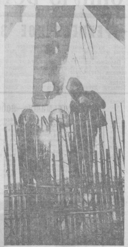
Полным ходом идут работы по сооружению Ташкентского метрополитана.

Давно уже работники милиции научились путь, по которому «улыбался» зерно с рискомобилата. И лишь после долгих на более чем десятилетнем этапе, в опыте, накопленном за это время, а еще и в том трудолюбии, упорстве, с которыми берется