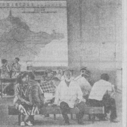
В Андиране вступила в эксплуатацию новая автозаправка. В двухэтажном корпусе — билетные кассы, просторный зал ожидания, комнаты отдыха, ресторан. НА СНИМКЕ: в зале ожидания.

Сегодня ночью и завтра днем ожидается малооблачная погода, без осадков. Ветер западный, 7—12 метров в секунду. Температура ночью 19—21, днем 37—39 градусов тепла.