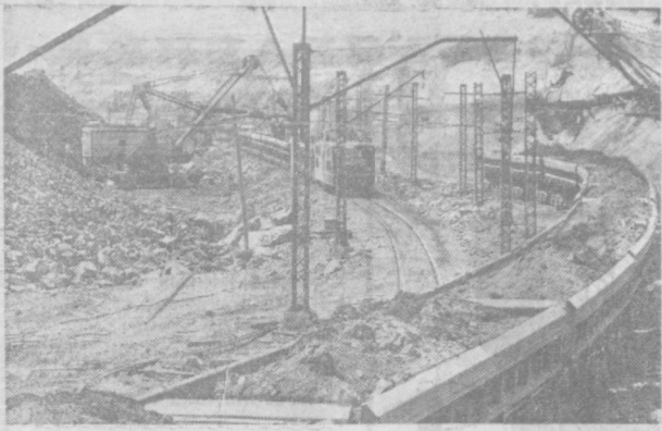
БЕЛГОРОДСКАЯ ОБЛАСТЬ. Ускоряются темпы освоения запасов гигантских рудных кладовых Курской магнитной аномалии. НА СНИМКЕ: погрузка свертлановой руды, добытой горняками Лебединского рудника.