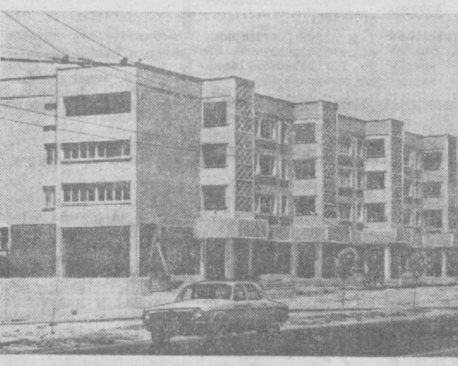
ТАШКЕНТ СЕГОДНЯ. Новый жилой дом на проспекте Беруни.

Депутаты наметили конкретные меры по обеспечению бесперебойной работы в осенне-зимние месяцы промышленных предприятий, строительных, транспортных и других организаций, детских и медицинских учреждений. Особое внимание обращено на улучшение подготовки к непогоде жилого фонда района.