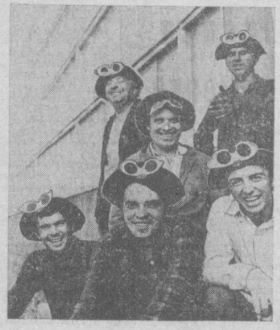
В Болгарии широко развернулось социалистическое соревнование за досрочное выполнение задания шестой пятилетки, достоянную встречу XI съезда КПС.

БЕЛГРАД. Более 180 тонн рыбы в сутки — таков средний улов югославских рыбаков из рыболовецкого «Деламарис». Труженики комбината успешно выполнили план первого полугодия.