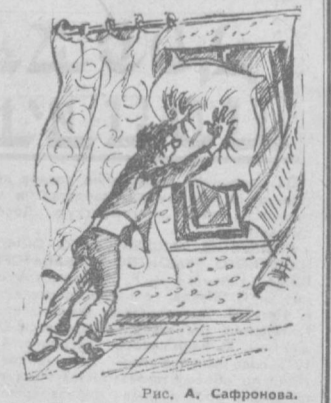
Рис. А. Сафронова.