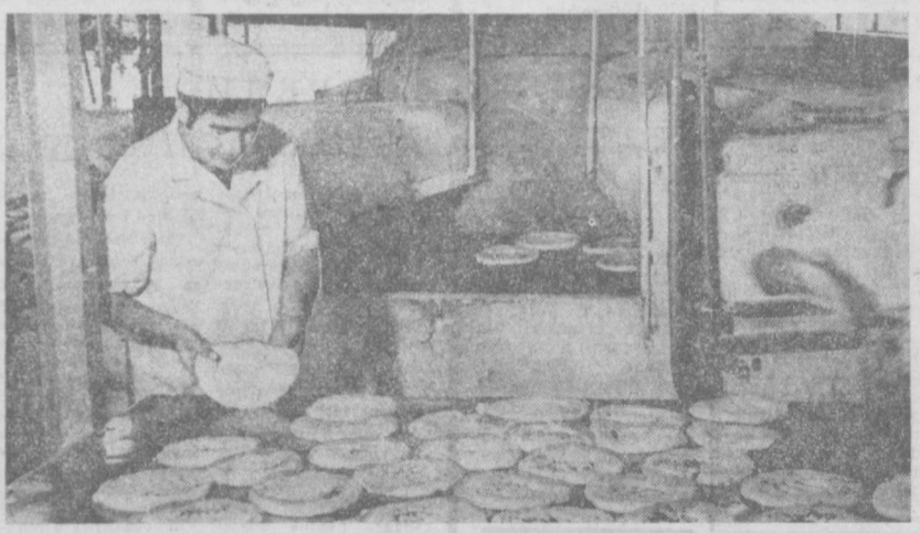
Техническая новинка при выпечке лепешек применяется в объединении «Ташнитхлеб»: продукция на стадии выпечки обогретается специальными лампами...