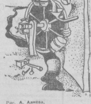
Рис. А. Алиева.