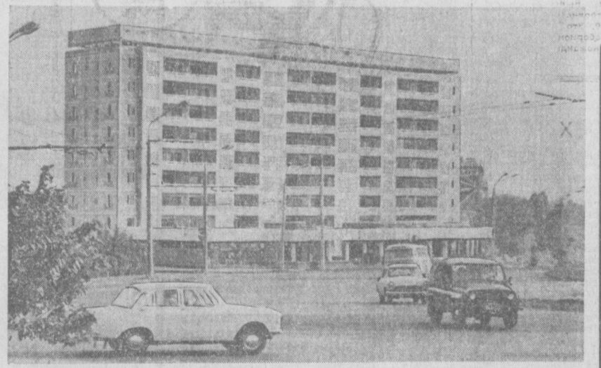
ТАШКЕНТ СЕГОДНЯ. Новый жилой дом на проспекте М. Горького.

«Передовой опыт борьбы за качество» — ценные показатели производства «Правды». В ней, в частности, отмечено: «Чем быстрее растет доля изделий высшей категории и снижается число устарев-