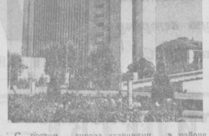
С ростом города возрастают эксплуатационные нагрузки на центр, однако резервы, которые были заложены в проекте 1967 года, позволяют дальнейшее развитие туризма, обеспечение емкости ресторанов, кафе, закусочных, кинотеатров со значительным превышением норм.

нам в величавой незавершенности всех «плавающих» в зелени доминант, объединенных ритмами сгущения и разряжения возникающих вокруг них долей зрительно-эмоционального напряжения. В центре города создана система взаимосвязанных ансамблей, совпадающих или тяготеющих и эспланаде протяженностью 4,5 километра. В ней нет