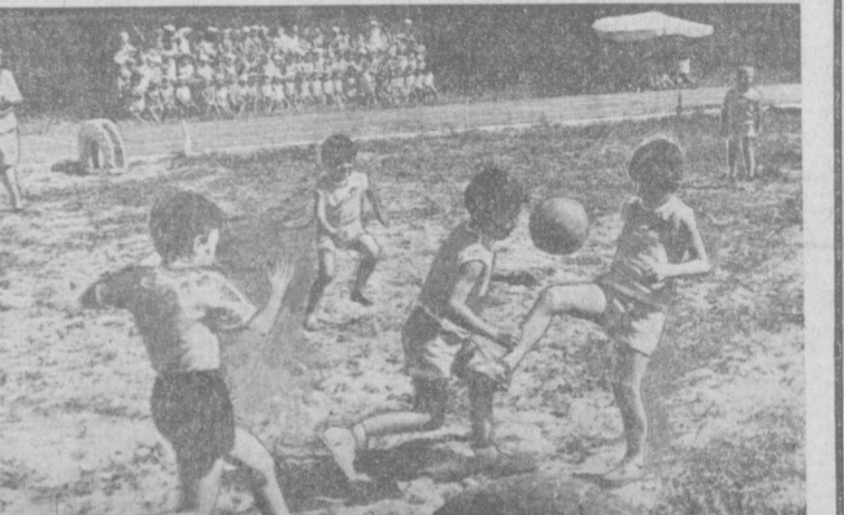
Футбол: первые шаги.