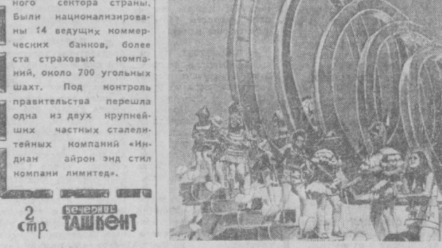
27 августа 1975 г.