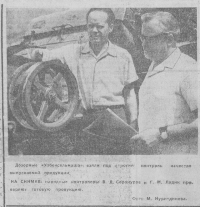
Дозорные «Узбелсельмаша» взяли под строгий контроль качество выпускаемой продукции.

Эту картину можно наблюдать на стоянке «маршруток» у гостиницы «Ташкент». Около одних автобусов (16, 19 «маршруток») стоит длинная очередь пассажиров, а у других автобусов — очередь диспетчеров. Вот тут бы и переключить диспетчера маршрута на другой, но такого почти не случается. Отмечать путевые листы — единственное занятие диспетчера. Часто он даже не может сказать пассажирам, когда ожидать микроавтобуса и сколько их на линии. — Ждите, — единственный ответ. А как уговаривает диспетчер совершить водителям необходимый рейс. Слово просят о великом личном одолжении! Только люди с очень большой фантазией могут назвать такого человека диспетчером. О. ХАЗИЕВА.