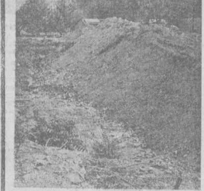
На месте этих куч земли на улице Д. Абдулова была когда-то дорога, зеленели деревья. Но несколько месяцев назад сюда пришли строители, чтобы возвести мост. Дружно взялись за дело: сломали деревья, перепахали тротуары и... исчезли.