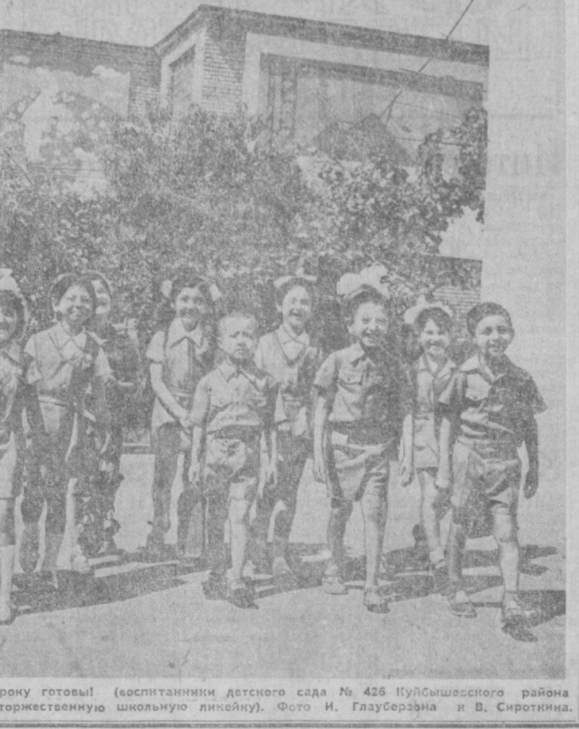
К первому уроку готовы! (воспитанники детского сада № 426 Кулсайхонского района отправляются на торжественную школьную линейку).