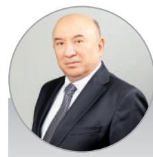
Равшан ФОЗИЛОВ, Олий Мажлис Қонунчилик палатаси депутати

Хулоса қилиб айтганда, коррупция соҳа, тизим танламаяпти, коррупция бугун бору, эртага ўз-ўзидан йўқ бўлиб кетадиган иллат ҳам эмас. У барча турдаги тадбиркорликнинг ривожланишига жиддий тўсиқ бўлиб, мамлакатнинг иқтисодий ўсишини секинлаштириб, адолатсиз рақобатни кучайтиради. Энг ёмони, қонунсизликни рағбатлантиради. Шу боис, давлат ва жамият биргаликда бу иллатга қарши қатъий чоралар кўриши лозим. Унутмайликки, коррупция мавсумий муаммо ҳам эмас. Уни фақат курашибгина енга оламиз.