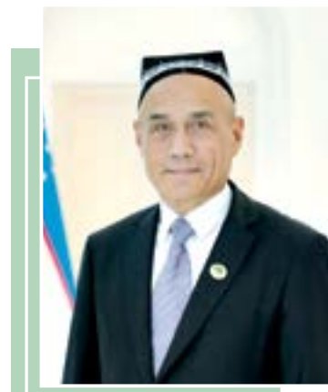
Shuhrat SIROJIDDINOV, akademik

Tonggi shiddat bilan harakatlanayotgan shahar ko'chalarida hayot o'ziga xos shovqin-suron bilan davom etmoqda. Taksilar shoshib harakat qiladi, odamlar ishga o'tlanadi, bozorlarda savdo qiziydi. Ammo bularning orasida ko'zga u qadar tashlanmaydigan, biroq jamiyatni ichdan yemirib boruvchi bir illat bor — korrupsiya.