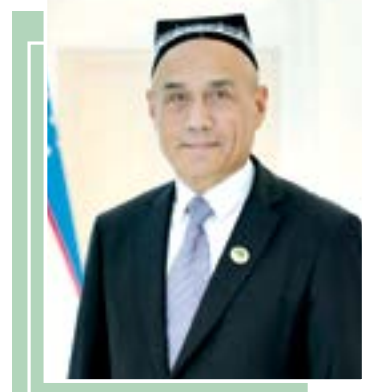
Шухрат СИРОЖИДДИНОВ, академик

Тонги шиддат билан ҳаракатланаётган шаҳар кўчаларида ҳаёт ўзига хос шовкин-сурон билан давом этмоқда. Таксилар шовиб ҳаракат қилади, одамлар ишга отланади, бозорларда савдо қизийди. Аммо буларнинг орасида кўзга у қадр ташланмайдиган, бироқ жамиятни ичдан емириб борувчи бир иллат бор — коррупция.