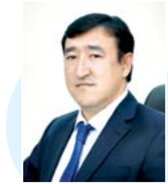
Абдулазиз РАСУЛЁВ, Ўзбекистон Республикаси Президенти ҳузуридаги Қонунчилик ва ҳуқуқий сиёсат институти илмий котиви, юридик фанлар доктори, профессор

Асосий қонуннинг 49-моддасига мувофиқ, давлат қўлай атроф-муҳит, унинг ҳолати тўғрисида ишончли маълумот олиш, шаҳарсозлик ҳужжатлари лойиҳаларини муҳофиза қилишда жамоатчиликнинг иштироки этиш ҳуқуқини таъминлайди. Ушбу қарорнинг рўйбга чиқариши учун маҳаллаларнинг экологик қиёфасини яхшилаш, тоза ва обод муҳит яратиш, аҳоли саломатлигини мухтафамлаш, ўсимлик ва ҳайвонот дунёсини муҳофиза қилиш, кўпайтириш ва келажак авлод учун асраб-авайлаш, биохилма-хилликни таъминлаш давлат дастурини амалга оширишнинг устувор йўналишлари этиб белгилади.