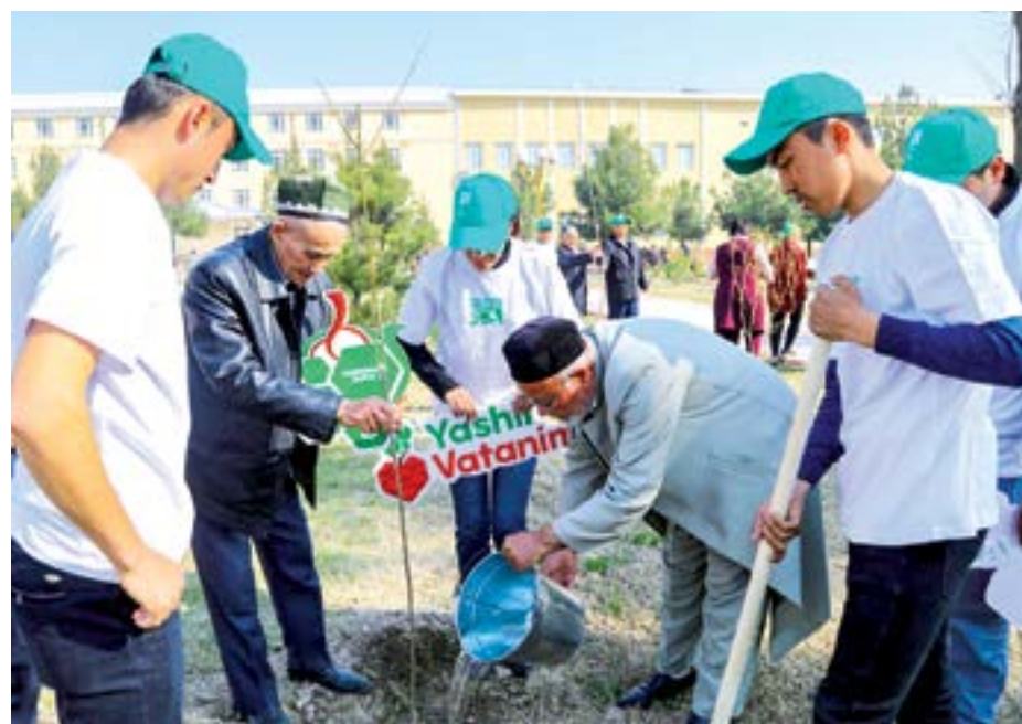
ҳамкорликни амалга оширишнинг ҳуқуқий механизми такомиллаштирилмоқда.

Давлат дастурида ҳуқуқий сиёсатни амалга ошириш, халқаро ҳамкорлик доирасидаги чора-тадбирлар ҳам ўз ифодасини топган. Дастур асосида халқаро ҳуқуқ нормалари ва халқаро