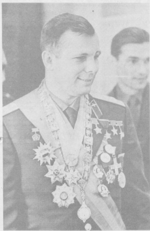
НА СНИМКАХ: Юрий Гагарин (1964 г.); в рабочем кабинете Константина Эдуардовича Эскуранты с интересом знакомятся с драгоценными реликвиями дома-музея К. Э. Циолковского.