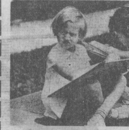
Юные художники. Эти маленькие варшавянки не видели, как вставал из пепла и руин их родной город. Для них Варшава — новые светлые дома, широкие улицы, красивые скверы, где играют такие же радостные, как и они, дети столицы свободной Польши. Фото ЦАФ—ТАСС.

Сегодня в Ташкенте небольшая облачность без осадков. Ветер неустойчивый. 3-7 метров в секунду. Температура 32-34, ночью ожидается 15-17 градусов тепла.