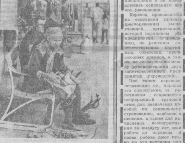
ШВЕЦИЯ. Продажа сувениров. Чтобы свести концы с концами, эти пожилые женщины приходят долгие часы прошивать на улицах города Кируна, предлагая туристам незамысловатые изделия народных умельцев.

ЛОНДОН. Одна из английских фирм выпускает двухслойное волокно «Кеморел», из которого можно изготовить различные виды синтетической ткани. Это волокно состоит из прочной сердцевинной и внешней оболочки. В определенных условиях внешняя оболочка волокна растягивается и соединяется с сердцевинной в прочную ткань. Таким образом можно изготовить легкую ковровую, обивочную и другие виды синтетических тканей.