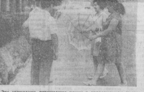
Эти гранданы, перешедшие улицу в неподобающем месте, постеснялись назвать свои фамилии и представились Дусей и Баллой. Но мы надеемся, что знакомые все равно узнают их.

ВОЗЛЕ Центрального универмага на углу улиц Узбекистанской и Ленина человеческий поток. Он течет от