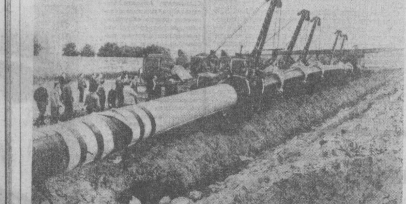
На территории Чехословакии успешно разворачивается строительство мощного транзитного газопровода, по которому советский газ пойдет потребителям ЧССР, ГДР, а также в страны Западной Европы.

НА СНИМКЕ: укладка труб в районе Трестена.