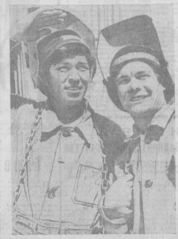
Коллектив строителей-монтажников СУ-17 одного из специализированных трестов «Высотстрой-11» возводит в Куйбышевском районе города новое семнадцатиэтажное производственно-техническое предприятие «Среднеагпрохоллом».