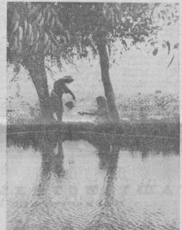
В жаркий летний полдень...

о космическом происхождении осадочных марганцевых месторождений выдвинул грузинский геолог Вахтанг Надирадзе. Ученый утверждает, что около двух миллиардов лет назад на поверхность Земли выпала обогащенная марганцем метеорная пыль, образовавшаяся в результате дулканических процессов на Земле и других планетах. Аккумуляция этой пыли образовала осадочные месторождения на суше и на дне морей и океанов. То обстоятельство, что почти все месторождения марганца образовались в течение короткого геологического периода, служит одним из подтверждений гипотезы. К. ЦХОМЕЛИДЗЕ, корр. ТАСС, Тбилиси.