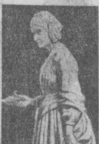
НА СНИМКЕ: памятник «Дева со светильником».