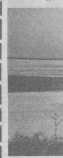
Скромный поход, увидеть долины, цветущие высокогорные луга и пастбища, дороги, пробирающиеся по крутым каменистым склонам и заоблачным перевалам...