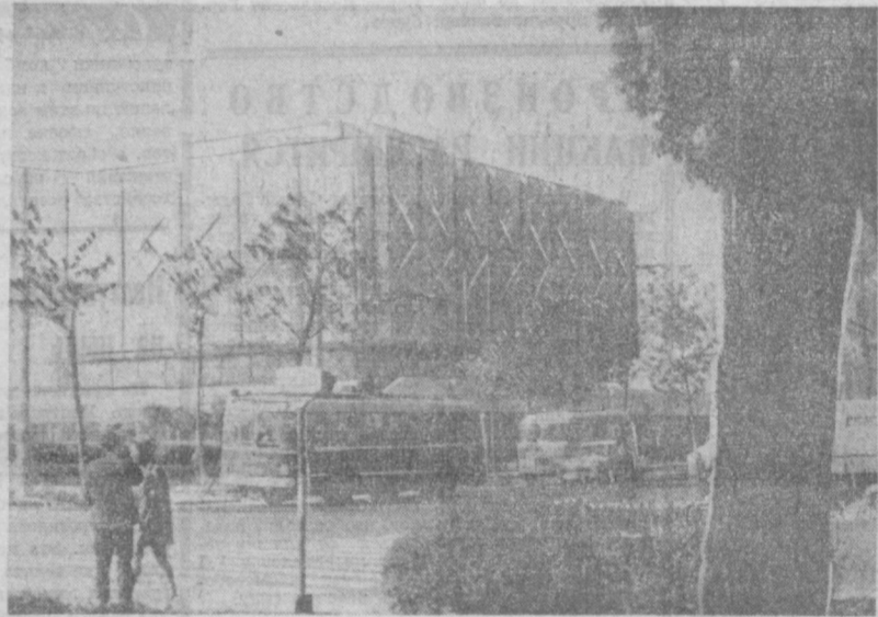
НА СНИМКЕ: улица Ленина.