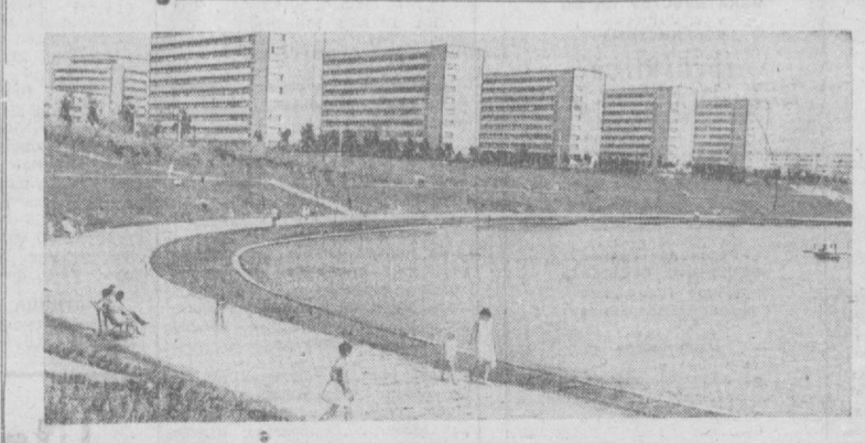
За годы народной власти значительно расширил свои границы Бухарест — столица социалистической Румынии.

В УДАНИТСКИЙ научно-исследовательский институт демографии опубликованы статистические данные о продолжительности жизни в стране за последние 70 лет. Данные свидетельствуют, что средняя продолжительность жизни жителей Венгрии примерно удвоилась. У мужчин, родившихся в начале века, она составляла 37, у женщин 38 лет. В настоящее время эти показатели равны соответственно 67 и 72 годам.