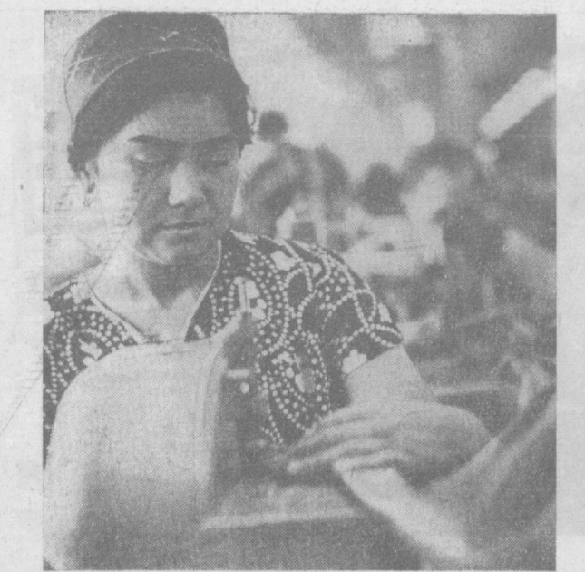
Успешно трудится коллектив Ташкентской трикотажной фирмы. Значительно перевыполнив план семи месяцев, труженики выпустили только с начала этого месяца почти на 100 тысяч рублей дополнительной продукции.

Сделано в Польше на рынках высокоразвитых стран, в том числе ФРГ, Англии, Швеции.