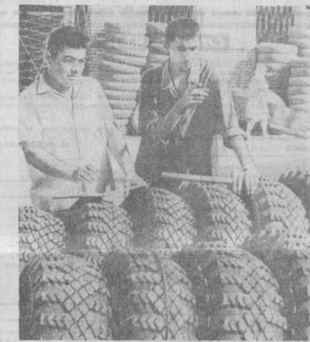
Коллектив шиноремонтного завода № 9 объединения «Узрезшина» в плитке вытиснит более 200 тысяч автошин. Сейчас здесь реставрируются шины для автомобилей «МАЗ», «КРАЗ», «ЗИС», «ГАЗ», а также для всех легковых машин отечественного производства. Часть продукции отправляется в троллейбусной парки города.

На базе магазина организована школа для подготовки продавцов. Десятки будущих работников приваки уже начали учиться торговать. А практика у них будет богатая. Все необходимые навыки они приобретут здесь же, в магазине.