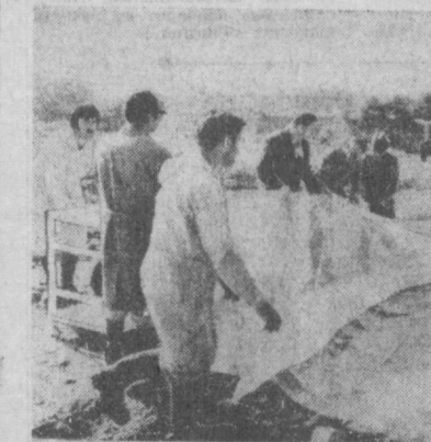
В ФРГ разрастается скандал в связи с вывозом на свалки ядовитых производственных отходов химической фирмой «Ферригисте» химической. Содержащийся в них мышьяк и даже один его испарения опасны для любого живого существа, а после дождя яд может проникнуть в почву и отравить грунтовые воды. Эксперты, обследующие местность, уже зарегистрировали наличие мышьяка в воде водоемов.

В АШИНГТОН. Состоялась встреча министра труда США Дж. Ходжсона и одного из экономистов советского Белого дома Дж. Шульца с членами исполнительного комитета Федерации труда и конгресса производителей профсоюзов (АФТ-ИП). Правительство США пыталось заручиться с поддержкой профсоюзов для своих мер по оздоровлению экономики США. Однако эта встреча привела лишь к дальнейшему обостре-