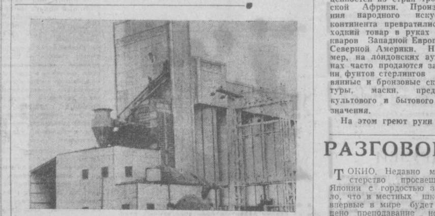
КУБА. В стране успешно решается задача полного обеспечения населения рисом за счет национального производства. В шести провинциях страны созданы специализированные рисоводческие хозяйства, общая площадь которых после завершения освоения всех земель составит 230 тысяч гектаров. НА СНИМКЕ: одна из новых рисососудиль, построенных в стране.

ПЕРЕЕЗД «СИРЕНЬ» В БЛИЖАЩЕЕ время с конвейеров Варшавского завода легковых автомобилей перестанут сходить знаменитые «Сирени». Принято решение перенести их выпуск на завод транспортного оборудования в город Вельско-Бяда. Это предприятие будет модернизировано, современные методы сборки позволят значительно увеличить выпуск машин. Усовершенствованные «Сирени» смогут служить польским автомобилистам еще в течение нескольких лет, пока не развернется производство новой автомашины, отвечающей последнему слову техники. Варшавский автомобильный завод полностью перейдет на выпуск польских «Фятов».