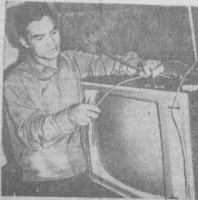
На Каранамыше началось подключение телевизоров к коллективным наружным антеннам и установка цветных телевизоров.