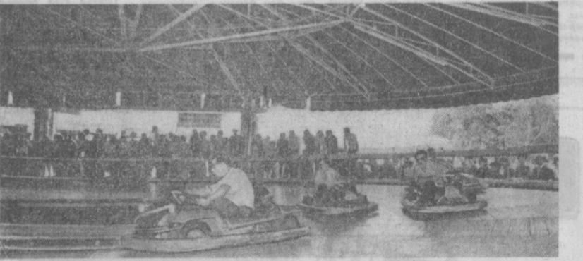
В Москве открылась международная выставка современных аттракционов и развлекательных автоматов — «Аттракцион-71». Многочисленные экспонаты этого необычного зрелища, впервые проводимого в Советском Союзе, разместились в Центральном парке культуры и отдыха имени М. Горького и в Измайловском парке. На выставке представлены оригинальные карусели, горки для катания, миниатюрные автоматы, кегельбаны. Дети смогут совершить полеты на космическом корабле и реактивном самолете, научиться управлять автомобилями. НА СНИМКЕ: автоаттракцион итальянской фирмы «Верта Ззон».

Д О сих пор село Субботово, что на Черкасщине, было известно как место где жил и захоронен славный сын украинского народа Богдан Хмельницкий. Оказывается, что это село куда более древний исторический памятник. Экспедицией Института археологии Академии наук Украины здесь обнаружены следы киммерийской эпохи, которая предшествовала скифской (VIII век до нашей эры). Археологи раскопали территорию около 300 квадратных метров. Здесь обнаружены следы былой битвы. В частности, среди орудий найдены большой железный меч с медной рукояткой и наконечник от ножен. Все признаки говорят о том, что он — священный меч киммерийской эпохи. Профессор А. И. Тереножкин, руководивший раскопками, заявил, что меч, найденный в Субботово, является уникальным. Его длина вместе с рукояткой достигает 116 сантиметров. Ясно что это — оружие конного воина. До сих пор были известны только короткие киммерийские мечи, предназначенные для пешехода. Кроме того, есть основание предполагать, что изготовлен этот меч местными ремесленниками. Такой вывод дает новые данные для истории и культуры до скифских племен, населявших Восточную Европу. (Корр. ТАСС). Черкассы.