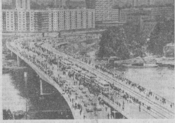
ГДР. Новый 375-метровый мост через Эльбу построен в Дрездене. Он соединил главный железнодорожный вокзал города с площадью Единства, расположенной в районе современных кварталов.

и культуры Каракалпакстана, о прошлом этого края. В дни уборочной кампании передвижной музей побывает во многих районах автономной республики.