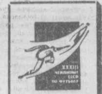
Завоеватель Кубка Средней Азии и Казахстана

Идущий на третьем месте одесский «Черноморец» вынужден был довольствоваться