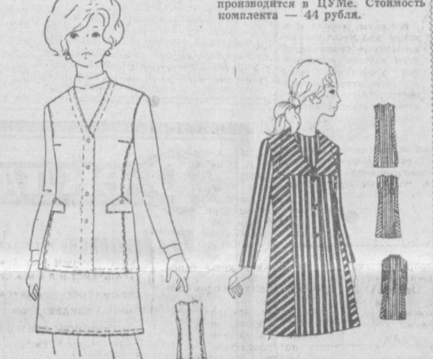
НА РИСУНКАХ: новые изделия Ташкентского Дома моделей.

Реализация новой продукции производится в ЦУМе. Стоимость комплекта — 44 рубля.