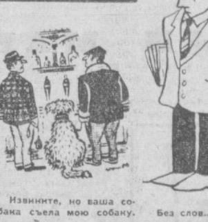
Извините, но ваша собака съела мою собаку. Без слов...