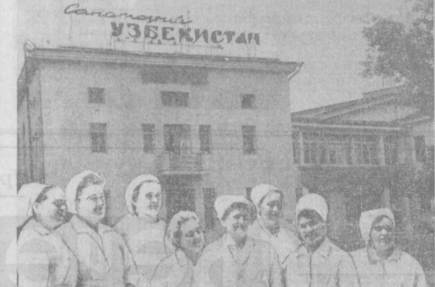
ре десятилетия многие узбекистанцы побывали в своем санатории. Книжки отзывов полны такими словами: «Искренне, от души, от вырванного сердца благодарю...», «И сейчас, уезжая отсюда, узбекистанец, положив голову перед врачом, с благодарностью говорит: «Катта рахмат, ха-лук...».

рехлетием многие узбекистанцы побывали в своем санатории. Книжки отзывов полны такими словами: «Искренне, от души, от вырванного сердца благодарю...», «И сейчас, уезжая отсюда, узбекистанец, положив голову перед врачом, с благодарностью говорит: «Катта рахмат, ха-лук...».