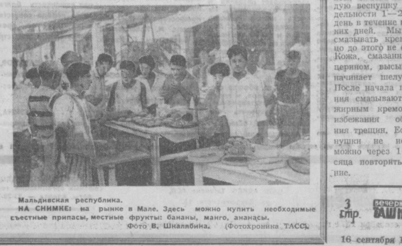
Мальдивская республика. НА СНИМКЕ: на рынке в Мале. Здесь можно купить необходимые съестные припасы, местные фрукты: бананы, манго, ананасы.