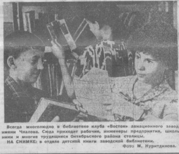
Всегда многолюдно в библиотеке клуба «Восток» авиационного завода имени Чкалова. Сюда приходят рабочие, инженеры предприятия, школьники и многие трудящиеся Октябрьского района столицы. НА СНИМКЕ: в отделе детской книги заводской библиотеки.