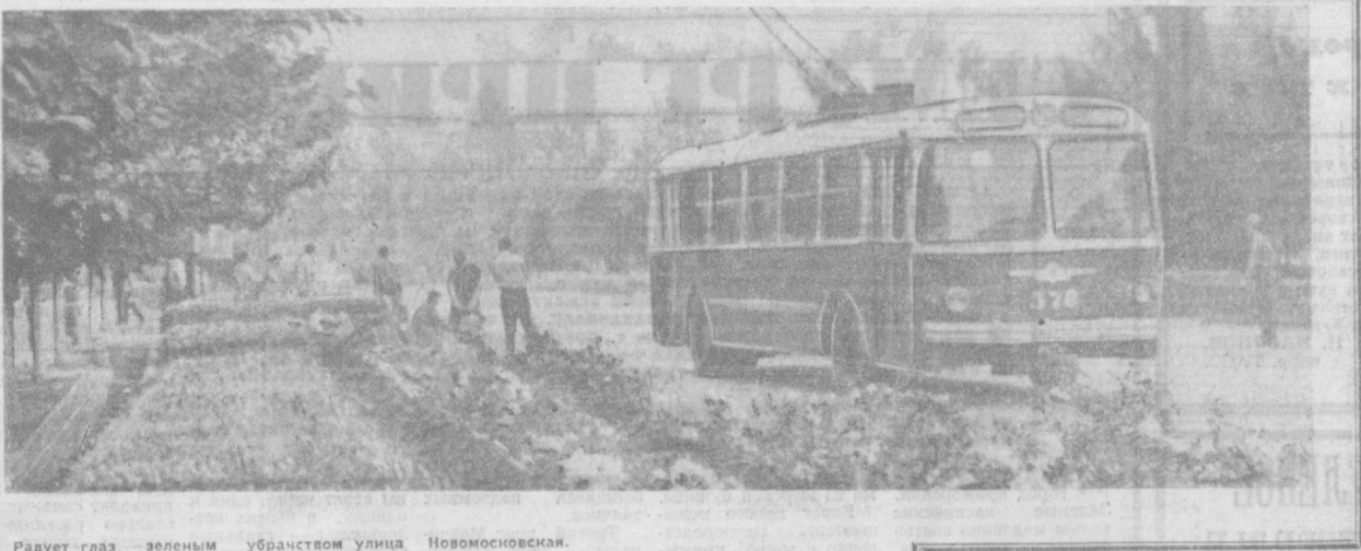
Радует глаз зеленым убранством улица Новосовская.