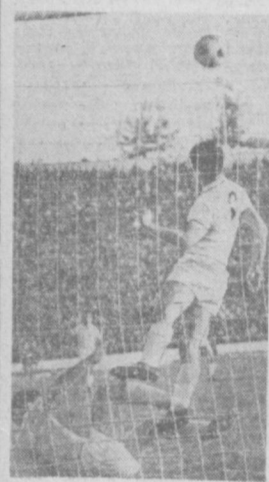
Любители футбола смогут посмотреть 20 сентября второй тайм турнира ветеранов.

ПОНЕДЕЛЬНИК — 20 СЕНТЯБРЯ Первая программа. Показывает Москва. 17.35 Для школьников. «Костер». Пионерский телеборни. 18.00 Музыкальная программа. 18.30 «Земля романтиков». Телеочерки. Показывает Ташкент. На русском языке: 19.05 «Ахборот». 19.20 «Советский воин». Телевизионный журнал. На узбекском языке: 20.20 «Навстречу Декаде казахской литературы и искусства в Узбекистане». Концерт эстрадного оркестра Казахского телевидения и радио. 21.00 «Ахборот». 21.20 «Мир сегодня». Показывает Москва. 22.00 «Время». 22.30 Поем М. Кристалинская. 23.00 Футбол. Турнир ветеранов. Финал. 2-й тайм. 23.45 Позня. У нас в гостях Роберт Рождественский. 00.10 Документальный фильм.