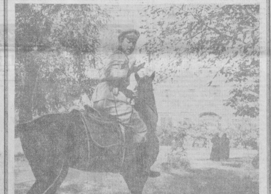
Республиканская контора по прокату кинофильмов.

В дни декады состоится кинофестиваль. Демонстрироваться будут новые художественные фильмы, киноленты выпуска прошлых лет и ряд хроникально-документальных и научно-популярных фильмов, всесторонне отображающих могучую поступь республики к коммунистическим вершинам.