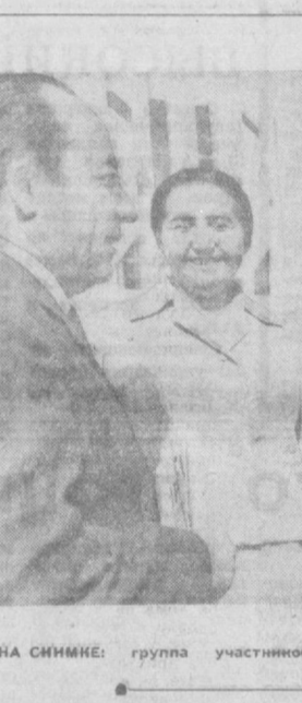
НА СНИМКЕ: группа участников собрания партийно-хозяйственного актива.

Слабо в Ташкенте решаются вопросы капитального строительства, повышения эффективности капитальных вложений. Ведущая строительная организация — Главташкентстрой все еще не использует всех своих возможностей, имеет низкие технико-экономические показатели и систематически срывает планы строительного-монтажных работ. За восемь месяцев из 12 строительных трестов план по генеральному подряду выполнили толь-