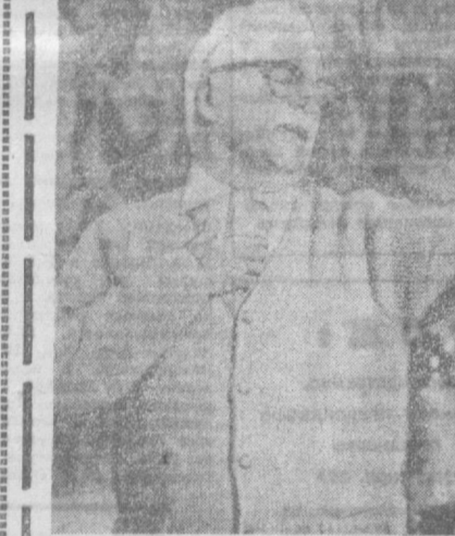
не дожил бы до своих лет, если бы не занимался музыкой. Хотя иногда дерби вставал каждый день, на час позже обычного и не делал утреннего и вечернего моциона. Живя физическую подвижность и вдох в пуэрториканском городе Сан Хуане, он ежедневно совершает в нишу фруктов (особенно цитру-

очень многих людей. Мы постепенно увеличиваем продолжительность жизни самыми различными мерами, но в большинстве случаев, как показывает статистика, пока еще медикаментами. Но есть и другой «эликсир жизни». Люди, которые пользуются им, побеждают старость и в свою жизнь сохраняют здоровье, работоспособность. И это не просто. Весной этого года испанскому виолончелисту Пабло Казальсу исполнилось 94 года. Он, наверно,