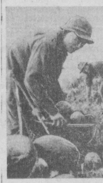
ЮНИЙ ВЬЕТНАМ. В освобожденных районах провинции Куангчи идет сбор урожая арбузов.

ЮНИЙ ВЬЕТНАМ. В освобожденных районах провинции Куангчи идет сбор урожая арбузов.