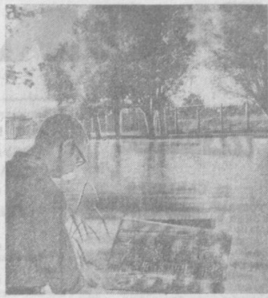
На осенних этюдах.

По пути домой я думала о том, что вот и наш небольшой музей что-то своему старшему брату, что все вместе мы делаем большое дело. Музей — это память народа. Нужно, чтобы ничего не было забыто. Ведь сила человека не только в его сегодняшнем дне, но и в прошлом. В его героическом прошлом. Л. НИКИТИНА, директор Музея истории Ташкентского текстильного комбината.