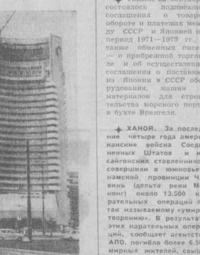
БУХАРЕСТ. Благоустрояется и растет столица Социалистической Республики Румынии. Строится новое светлое здание из стекла и бетона, появляются новые парки и скверы. В центре города выросло 24-этажное здание гостиницы «Интерконтиненталь» — часть архитектурного ансамбля, основу которого составляют гостиница и театр. НА СНИМКЕ: гордость жителей Бухареста — гостиница «Интерконтиненталь». (Фотокорреспондент ТАСС).

Тысячи студентов вузов и техникумов вернулись в свои аудиторию, оставив добрую память о себе на различных строительных республиках. Наполнились студенческими голосами и стены Ташкентского института народного хозяйства. Свыше тысячи человек выезжали отсюда на строительство объектов девятой пятилетки. С ними были учащиеся некоторых школ и профессионально-технических училищ города, которых считали трудновоспитуемыми. Подрастающие работники в составе студенческого отряда на строительстве Чарвакской ГЭС. Ребята участвовали в возведении самой плотины и сливного объекта, на строительстве стадиона и асфальтировании дорог в поселке Чарвак.