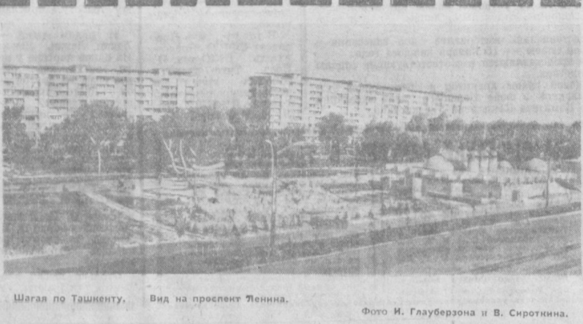
Шагая по Ташкенту. Вид на проспект Ленина.