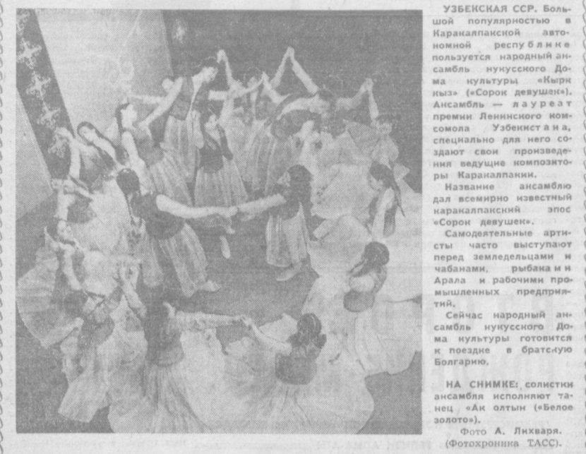
УЗБЕКСКАЯ ССР. Большой популярностью в Каракалпакской автономной республике пользуется народный ансамбль нунусского Дома культуры «Кырк кыз» («Сорок девушек»). Ансамбль — лауреат премии Ленинского комсомола Узбекистана, специально для него созданы свои произведения ведущие композиторы Каракалпаккии. Название ансамбля дано в честь известного каракалпакского эпоса «Сорок девушек». Самостоятельные артисты часто выступают перед земледельцами и чабанами, рыбаками и Арала и рабочими промышленных предприятий. Сейчас народный ансамбль нунусского Дома культуры готовится к поездке в братскую Болгарию. НА СНИМКЕ: солисты ансамбля исполняют танец «Ал олтун» («Белое золото»).

Конверты, вскрытые вчера ХОТЯ ВЕЛИК СПРОС ВСЕ БОЛЬШУЮ популярность приобретают газовые зажигалки. И очень удобно, когда они продаются в комплекте с «любимым топливом». Тогда и спрос будет еще больше. Для удобства населения следует также организовать мастерские, где можно было бы заправить зажигалку, а при необходимости ее отремонтировать. Н. СТЕПАНЧЕНКО.