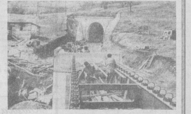
В Социалистической Федеративной Республике Югославии сооружается железная дорога Белград—Бар. Она свяжет столицу с недавно введенным в строй современным портом на побережье Адриатического моря. На пути новой магистрали будет построено 258 тоннелей и 217 мостов, общая протяженность последних составит 14 километров.